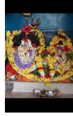
3. ಶ್ರೀ ಮರುಗಮ್ಮ ದೇವಿ