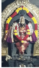
5. ಶ್ರೀ ಕ್ಷಣಾಂಭಿಕ ದೇವಿ