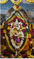
4. ಶ್ರೀ ಹಿರಿದೇವಮ್ಮ ದೇವಿ